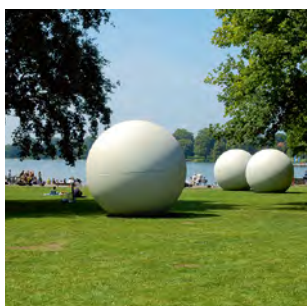
Kultur erleben, Entspannung genießen: Naherholung am Aasee

Die Westfälische Wilhelms-Universität Münster wurde 1780 gegründet und ist heute eine der fünf größten Universitäten Deutschlands. Mehr als 40.000 Studierende verteilen sich hier auf über 110 Studiengänge. Ihren guten Ruf verdankt die Universität insbesondere den Rechts- und Wirtschaftswissenschaften. Der Hauptsitz der Universität befindet sich heute im Fürstbischöflichen Schloss von Münster, einem von vielen herausragenden Bauwerken des Barock, die der Architekt Johann Conrad Schlaun in Münster und im Münsterland errichten ließ.