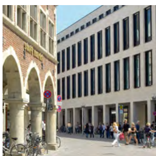
Geschichte trifft Gegenwart: die City mit den Münster-Arkaden

Der Zertifikatskurs Mergers & Acquisitions findet im Kettelerschen Hof im Herzen von Münster statt. Umgeben von der einzigartigen Atmosphäre der historischen Innenstadt bieten die modern ausgestatteten Tagungsräume ideale Voraussetzungen für eine konzentrierte, erfolgreiche Kursteilnahme. Wer eine Übernachtungsmöglichkeit benötigt, findet in Münster viele attraktive Adressen – von gemütlichen westfälischen Pensionen bis hin zu anspruchsvollen Designhotels. Besonders gastfreundlich: Teilnehmer von JurGrad-Zertifikatslehrgängen genießen in vielen Fällen Vergünstigungen und Rabatte.