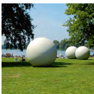
Kultur erleben, Entspannung genießen: Naherholung am Aasee

Die Westfälische Wilhelms-Universität Münster wurde 1780 gegründet und ist heute eine der fünf größten Universitäten Deutschlands. Mehr als 43.000 Studierende verteilen sich hier auf über 200 Studiengänge. Ihren guten Ruf verdankt die Universität insbesondere den Rechts- und Wirtschaftswissenschaften. Der Hauptsitz der Universität befindet sich heute im Fürstbischöflichen Schloss von Münster, einem von vielen herausragenden Bauwerken des Barock, die der Architekt Johann Conrad Schlaun in Münster und im Münsterland errichten ließ.