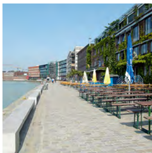
Neue Ausgehmeile am Münsteraner Stadthafen: der Kreativ-Kai